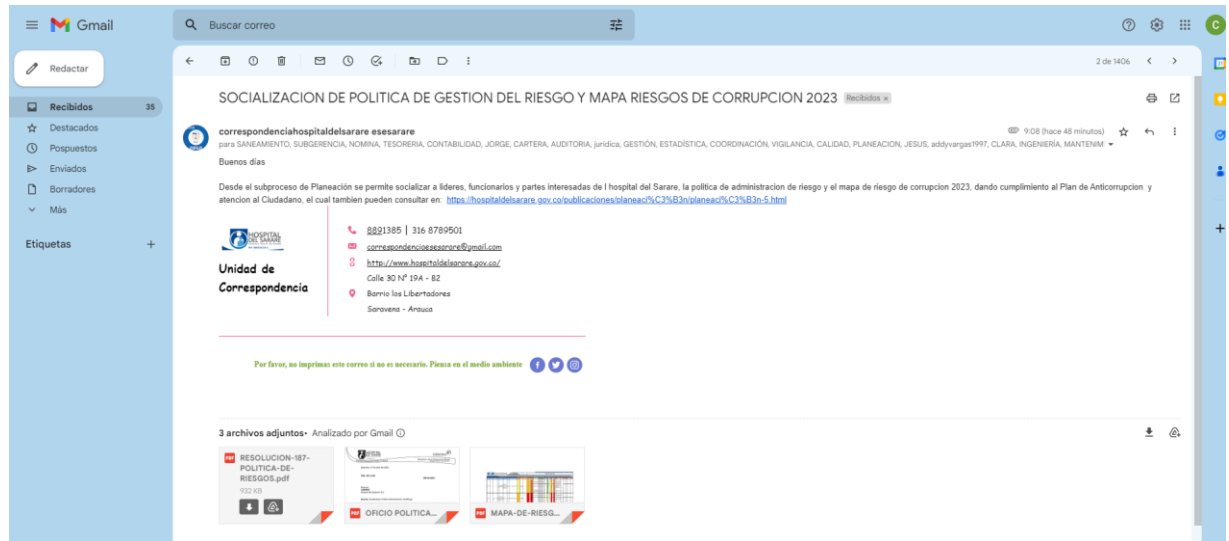
Fuente Pantallazo envió Correo Electrónico