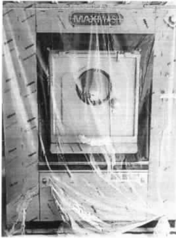
Imagen 4. Lavadora MAXI WASH SXTG600FDQ