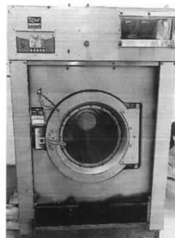
Imagen 5. Lavadora UNIMAC UX165