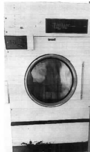
Imagen 3. Secadora UNIMAC UT12DE