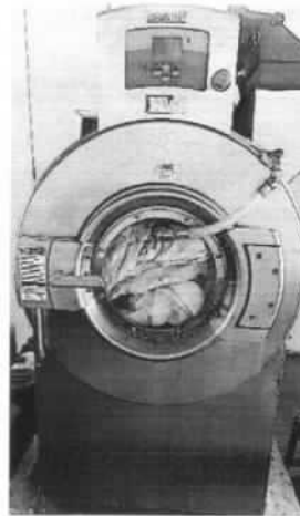
Imagen 5. Lavadora UNIMAC UWG065