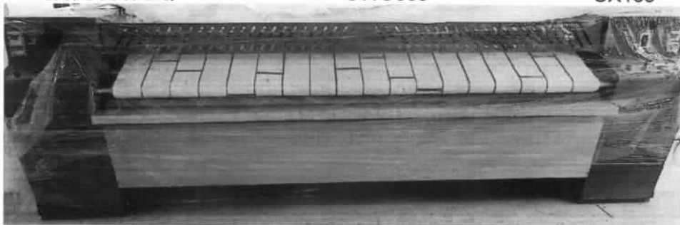
Imagen 6. Planchadora MAXI WASH YD-2800I