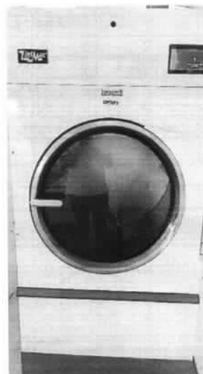
Imagen 2. Secadora UNIMAC UT075E